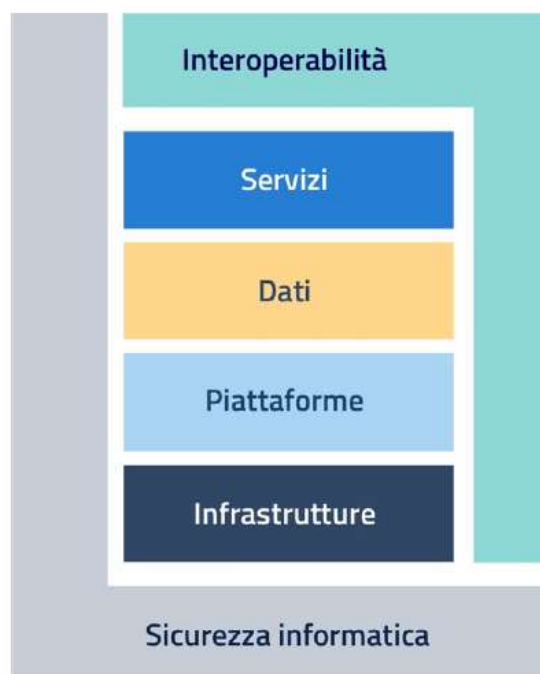
Figura 1 – Modello strategico di evoluzione del sistema informativo della Pubblica Amministrazione

Il modello strategico è stato schematizzato da AGID con la seguente figura: